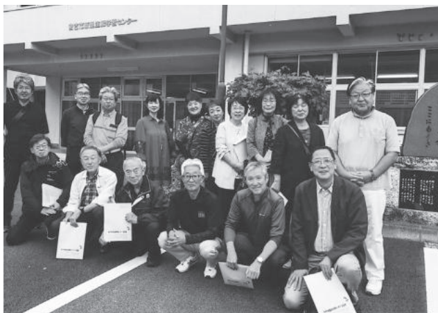
玄翁館にて参加者一同での記念撮影